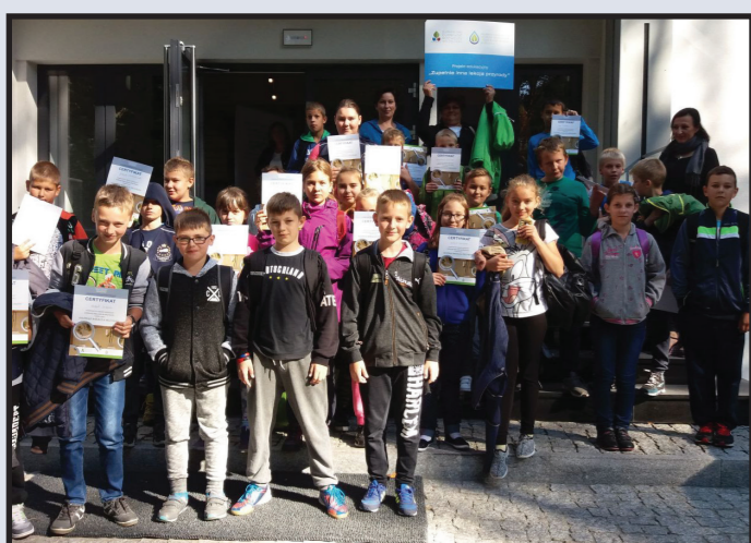
Ciekawa lekcja przyrody - PSP w Kołczewie