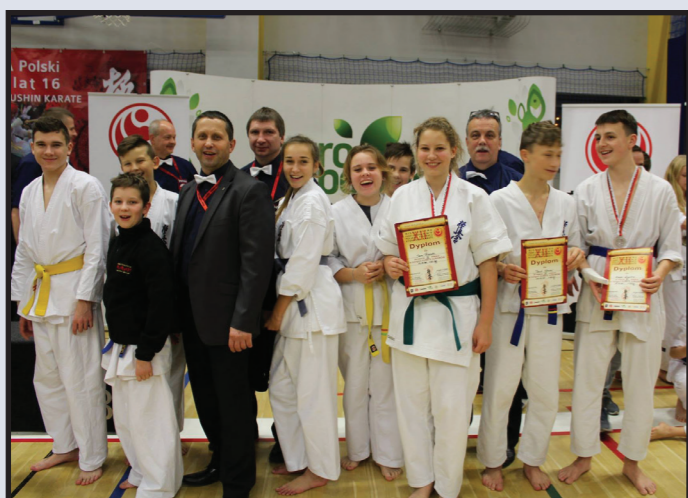
Wysokie miejsca na podium zawodników Wolińskiego Klubu Karate na Mistrzostwach Polski