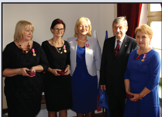
Pracownicy GBAS-u odznaczeni Złotymi Medalami za Długoletnią Służbę