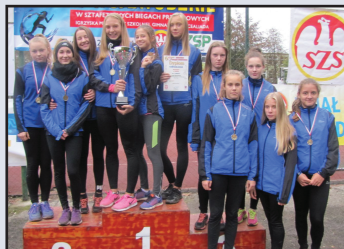
Lekkoatleci Publicznego Gimnazjum w Wolinie Mistrzyniami Województwa w Sztafetowych Biegach Przelajowych