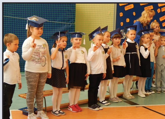
Pasowanie na ucznia w Publicznej Szkołe Podstawowej w Wolinie