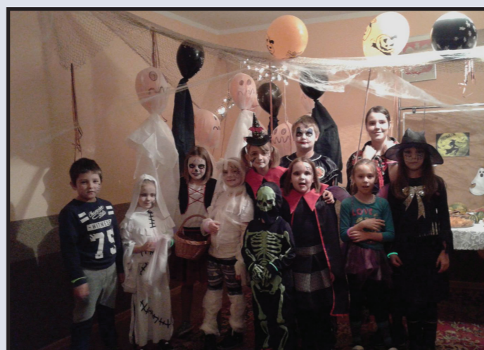
Impreza Halloween w Chynowie