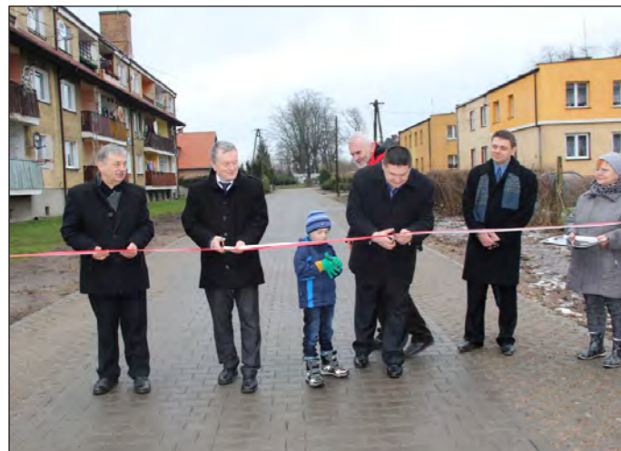
Otwarcie drogi w Uninie 0,6 km drogi/ponad 3000 m 2