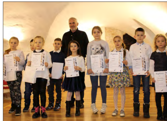
XXV Miejsko-Gminny Konkurs Recytatorski o Nagrodę Przewodniczącego Rady Miejskiej w Wolinie