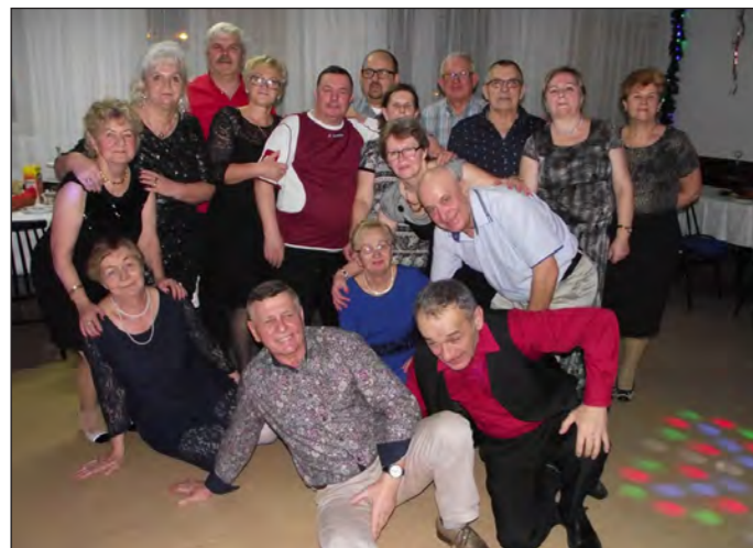
Członkowie Związku Emerytów Rencistów i Inwalidów w Wolinie świętowali Dzień Babci i Dziadka