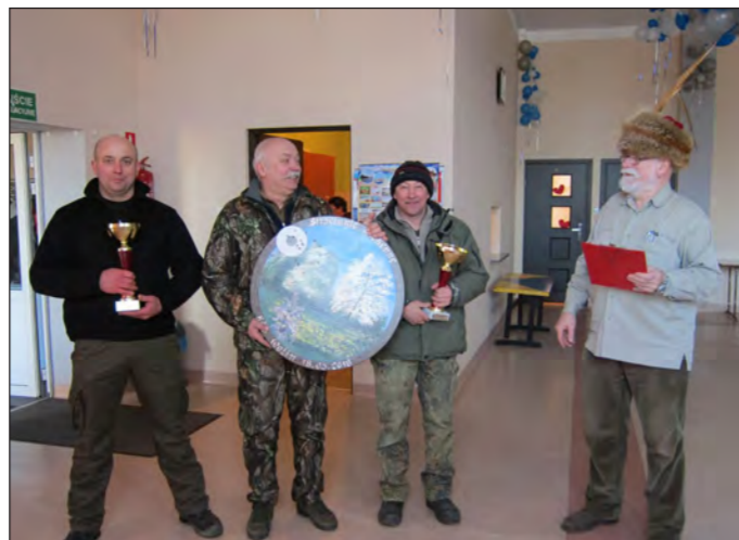
Strzelanie Wiosenne w Ładzinie