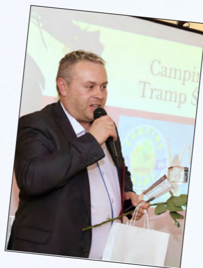
„Turystyka i wypoczynek” Camping nr 96 Tramp w Świątowie