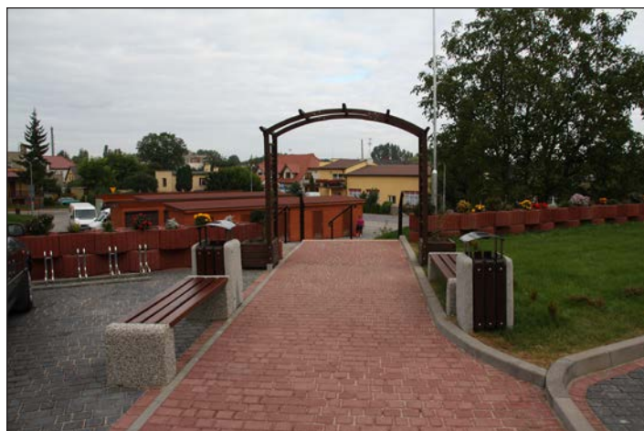
Zagospodarowanie terenu przy Targowisku Miejskim