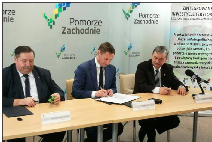
Przedstawiciele Gmin Wolin, Stepnica i Szczecin, podpisali porozumienie w sprawie realizacji tras rowerowych na wałach przeciwpowodziowych