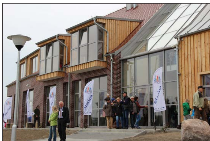
Rozbudowa i przebudowa UKS Albatros w Wolinie - Marina