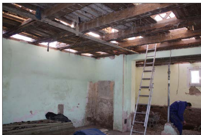
Remont świetlicy w Korzęcinie