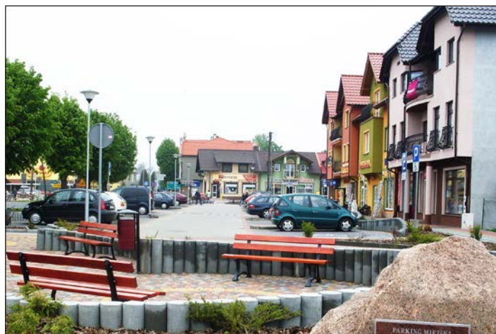
Budowa parkingów dla samochodów osobowych przy ciągu pawilonów handlowych ul. Gryfitów