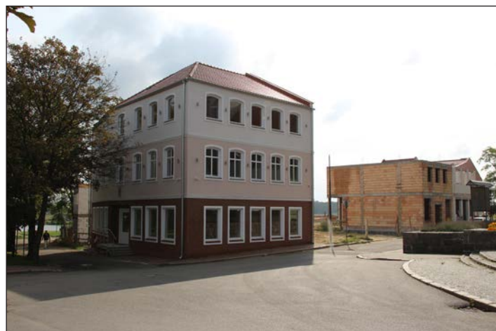
Nowa biblioteka w Wolinie, budynek rozpoczynający budowę kwartału „Stare miasto”