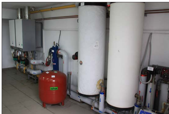
Modernizacja systemu grzewczego w PSP w Koniewie