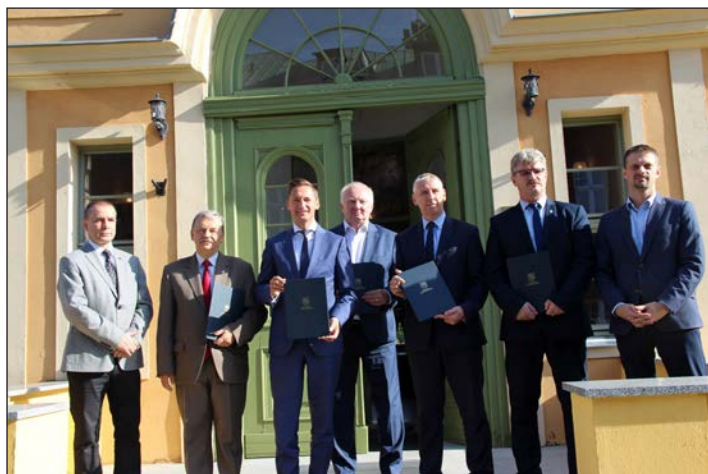
Podpisanie listu intwncyjnego uczestnictwa w projekcie Last Mile

Projekt LAST MILE będzie wspierać regiony w tworzeniu optymalnie zaprojektowanych rozwiązań dostosowanych do wielu typów użytkowników, w powiązaniu z głównymi liniami i ośrodkami transportu publicznego oraz wprowadzających niskoemisyjne, energooszczędne pojazdy co będzie prowadzić do zrównoważonych i możliwych do sfinansowania systemów regionalnej mobilności.