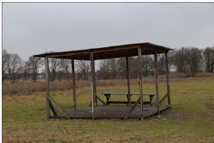
Miejsce organizacji zebrań wiejskich przez budową świetlicy

instalacji wod.-kan., elektrycznej, c.o. wraz z montażem pompy ciepła, wykonanie tynków i okładzin, posadzek, elewacji budynku, zagospodarowania terenu (ciągi pieszo-jezdne, parking, obiekty małej architektury)