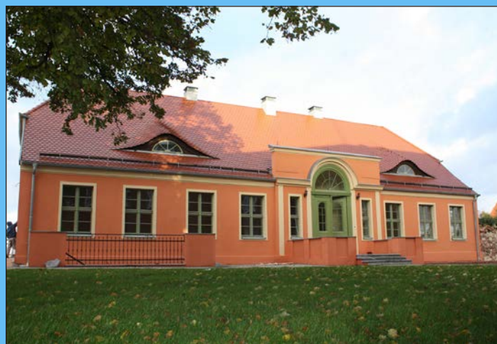
„Dworek Woliński” przed i po