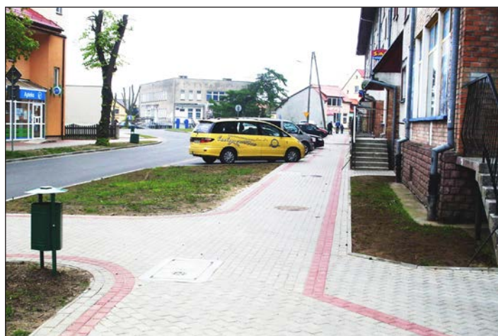
Modernizacja ul. Słowiańskiej od ul. Świerczewskiego do ul. Małej przed i po