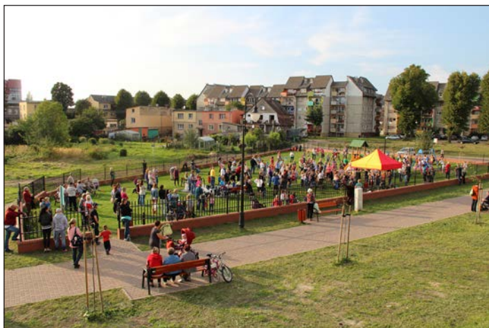
Drugi nowy plac zabaw w Wolinie