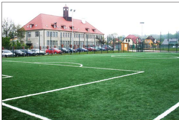
Budowa w Wolinie kompleksu boisk sportowych Moje Boisko - Orlik 2012