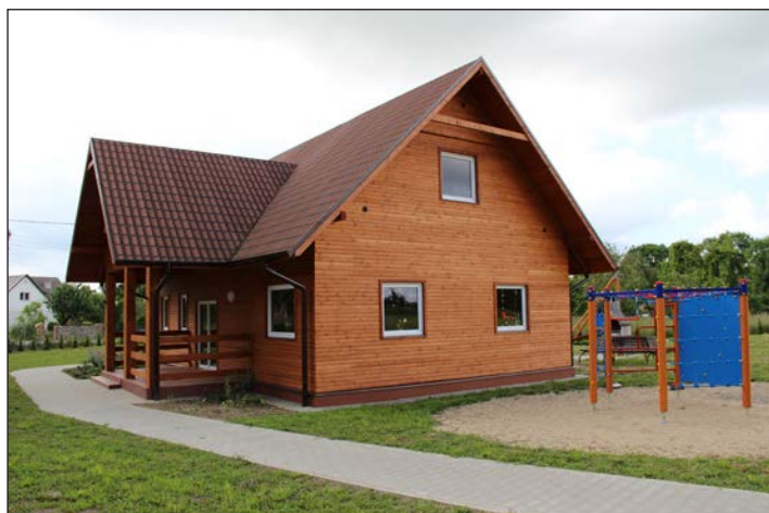
Budowa świetlicy w Lasce