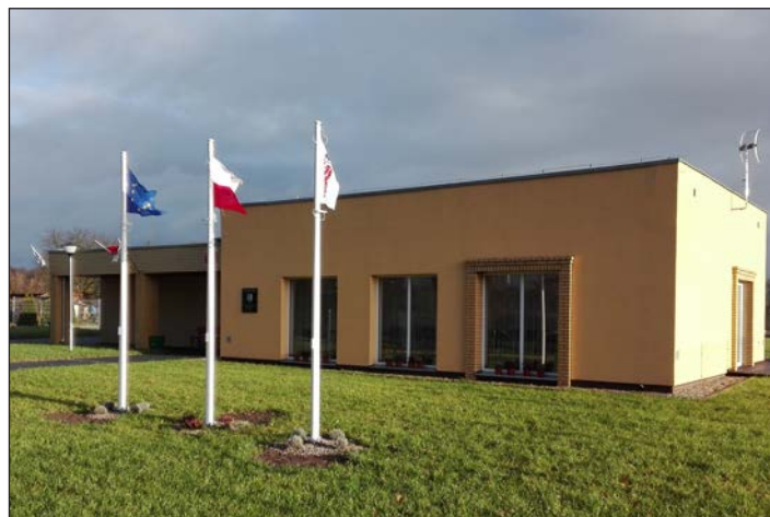
Nowa świetlica w Wiejkowie