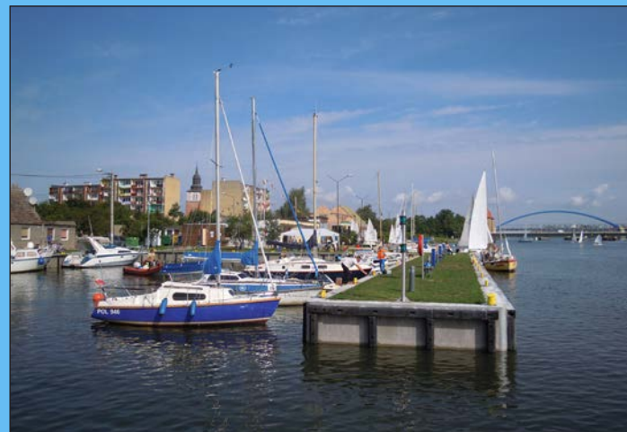
Basen jachtowy przed i po