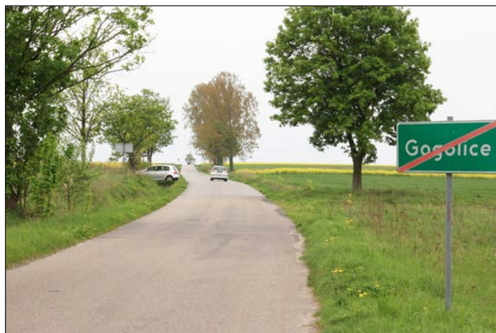
Przebudowa drogi powiatowej Gogolice Zagórze