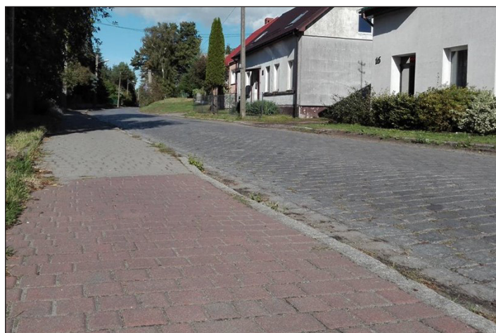
Budowa chodnika w Reclawiu