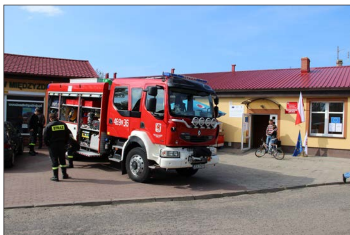
Nowy wóz strażacki dla OSP Kołczewo