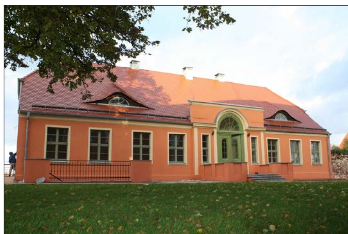
Odbudowa „Dworku Wolińskiego”