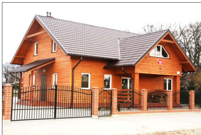
Nowa świetlica w Uninie

Europejskiego Funduszu Społecznego, Program Operacyjny Kapitał Ludzki (dofinansowanie 100 %, OPS - realizacja)