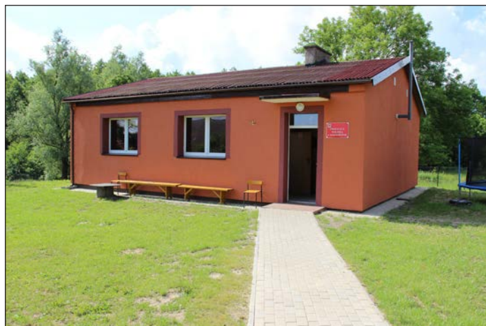
Rozbudowa świetlicy w Jarzębowie