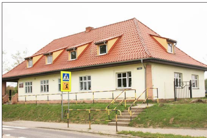
Ośrodek Wychowania Przedszkolnego w Kołczewie