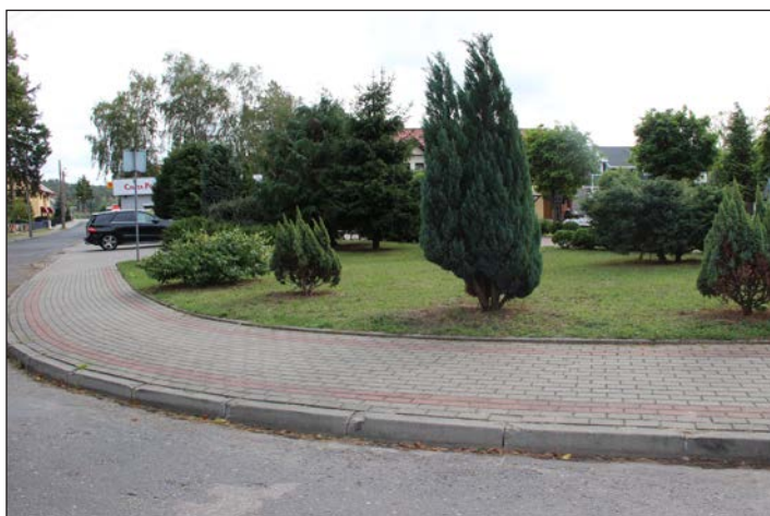
Budowa chodników oraz odwadnianie ul. Leśnej w Wisetce