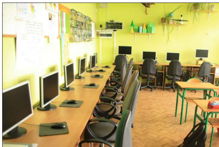
Pracownia komputerowa dla szkół- PSP Dargobądz, PSP Wolin, PSP Koniewo