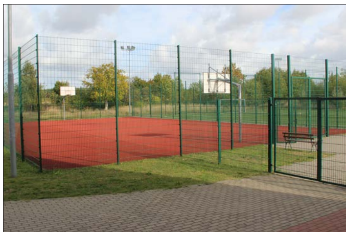
Boisko Orlik w Kołczewie