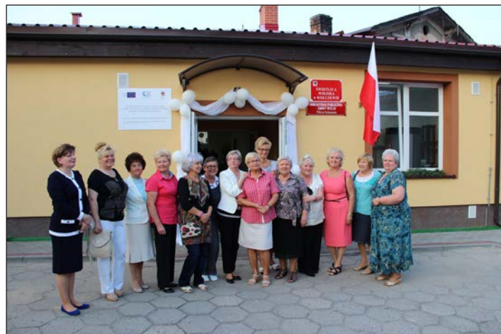
Modernizacja świetlicy w Kołczewie