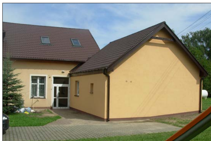
Budowa zaplecza kuchennego w świetlicy w Reclawiu