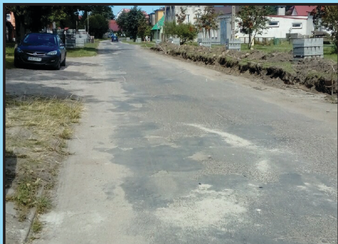
Ul. Słowiańska z nową nawierzchnią (900 m.), chodnikami i parkingami przed... po...