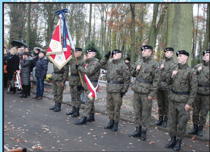
Powiatowe obchody Narodowego Święta Niepodległości – Wolin 2017