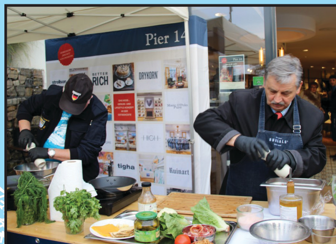
Burmistrzowe jesienne gotowanie w Zinnowitz