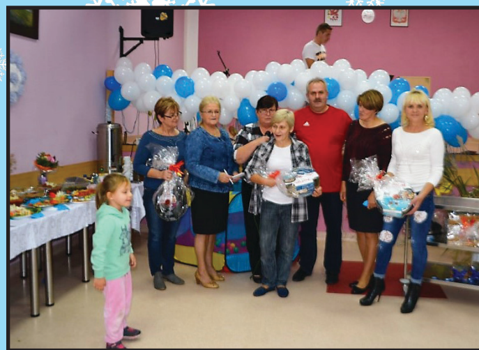
Dzień Ryby w Skoszewie – szósta edycja