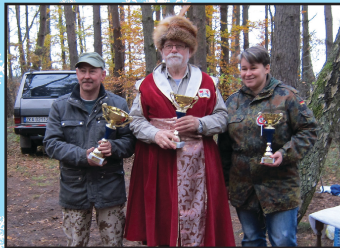
Strzelanie o Puchar Burmistrza Wolina z okazji Narodowego Święta Niepodległości