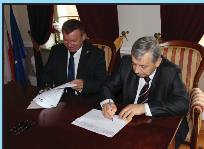
Gmina wyremontuje ul. Małą w Wolinie Marszałek dofinansowuje inwestycję