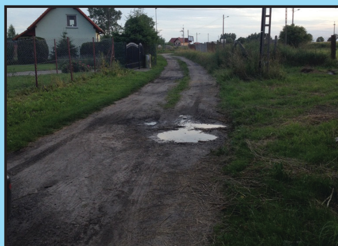
Droga w Zastaniu (896 m.) oddana do użytku przed... po...